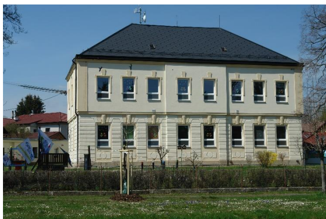
Budova MŠ se zahradou

Budova školy nyní slouží jako mateřská škola pro obce Bítovany a Zaječice. Většina dětí z Bítovan dojíždí do 1. až 5. třídy do ZŠ Zaječice, v posledních letech i do Lukavice, Slatiňan a Chrudimi. Do vyšších ročníků, do 6. až 9. třídy ZŠ dojíždí děti do Chrasti, Slatiňan a Chrudimi.