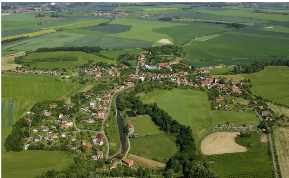
Letecký snímek obce z roku 2001

Časový horizont platnosti programu je stanoven na čtyři roky a to tak, aby tento program částečně pokryl období mandátu současného zastupitelstva obce a dále umožnil plynulou návaznost plnění programu novému zastupitelstvu, které vzejde z voleb v roce 2022, s cílem, aby současný program zásadně neomezoval vytváření koncepce rozvoje obce v období po roce 2025.