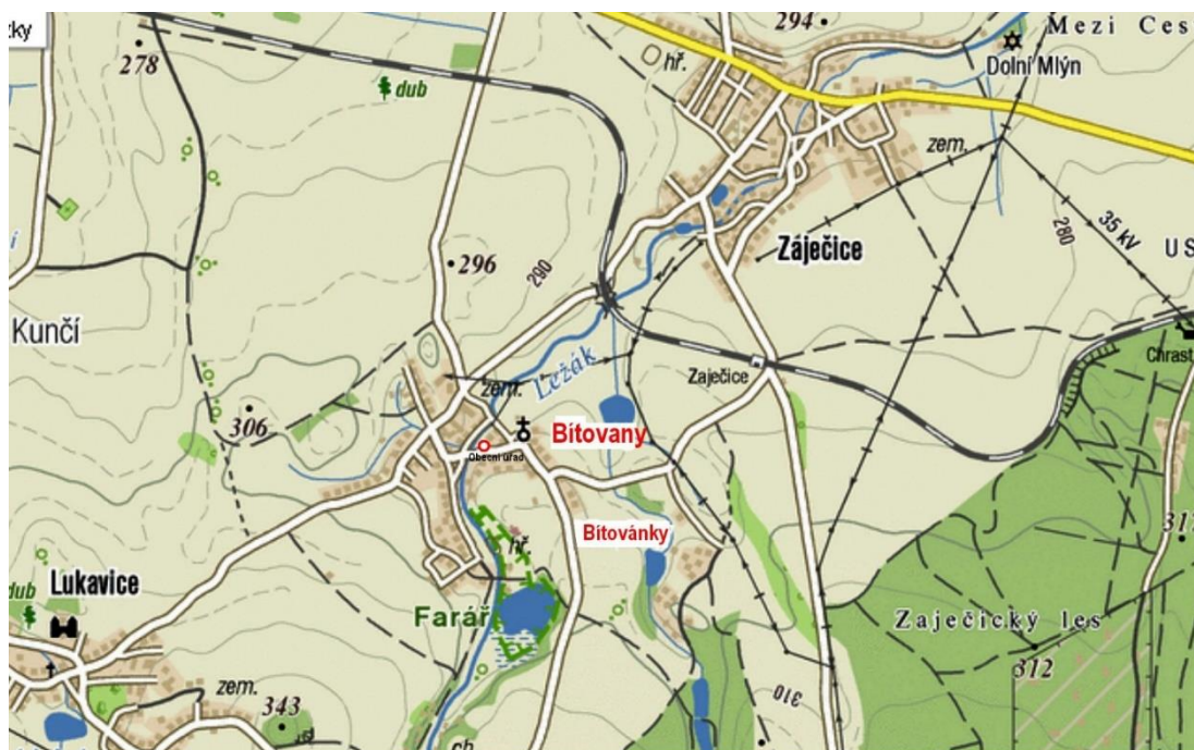
Mapa silničních komunikací — napojení obce Bítovany na sousední obce Lukavice a Zaječice

Obec Bítovany se nachází v Pardubickém kraji na úpatí Českomoravské vrchoviny v okrese Chrudim. Leží v sousedství katastrů obcí Lukavice, Zaječice a Žumberk při silnicích III/358 14 a III/358 16 ve vzdálenosti asi 10 km jihovýchodně od Chrudimě. Obec Bítovany je z hlediska dotačního členění součástí NUTS II Severovýchod (Pardubický, Královehradecký a Liberecký kraj).