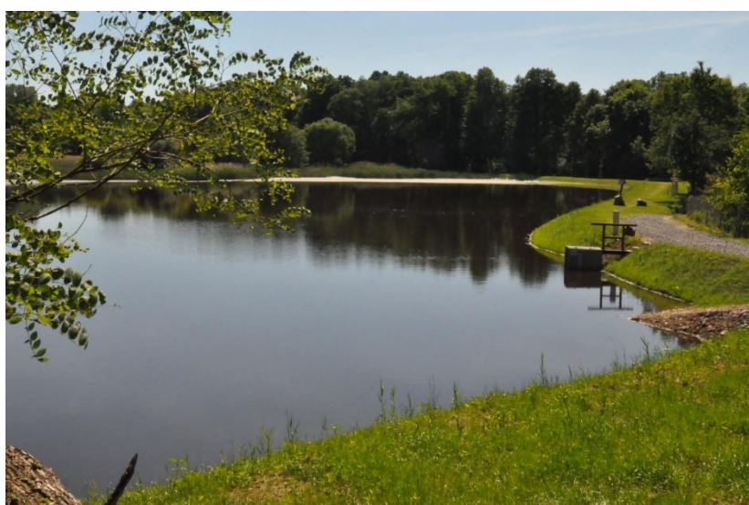
Snímek rybníku Farář, místo s výskytem chráněné vodní rostliny kotvice plovoucí

Obcí protéká řeka Holetínka (potok Ležák). V jihozápadní části katastru obce se nalézá rybník Farář, jenž je přírodní památkou s výskytem chráněné a kriticky ohrožené rostliny kotvice plovoucí (Trapa Natans).