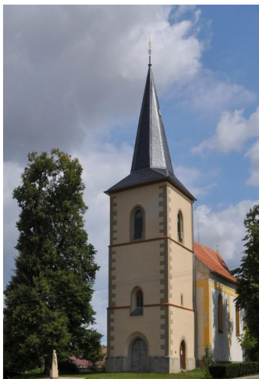
Kostel sv. Bartoloměje v Bítovanech

Bítovany byly v 19. století spojeny se Žumberkem, po roce 1900 samostatnou obcí, mezi léty 1974–1989 administrativně spojeny se sousední obcí Zaječice. V minulosti byl v obci dvůr, dva mlýny, dvě řeznictví, dvě hospody, dvě kovárny, tři obchody a pila. Od roku 1906 do roku 1974 byla v obci škola.