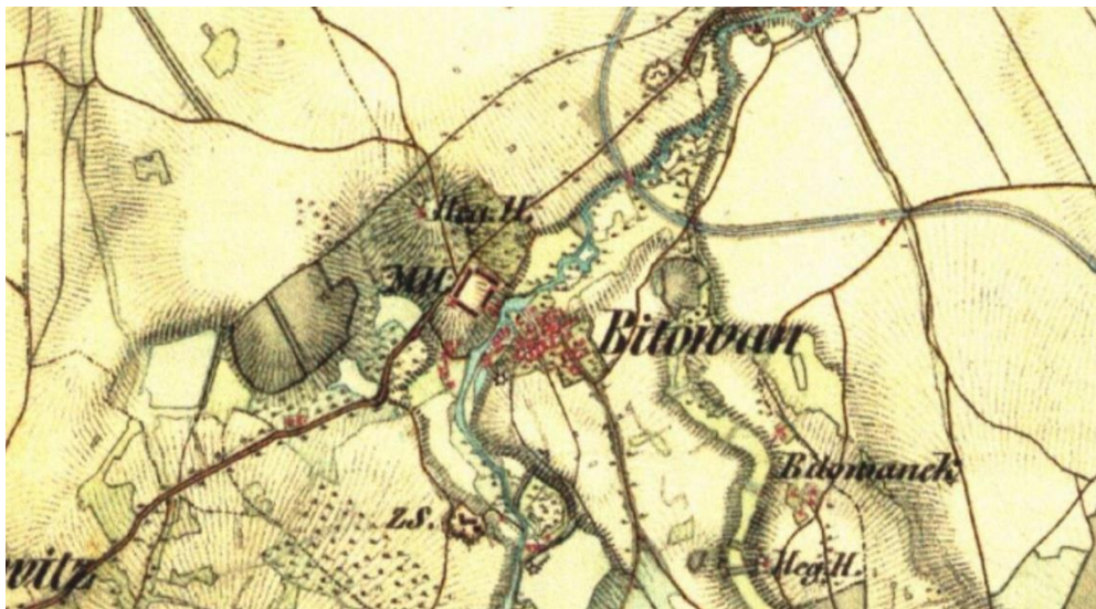
Bítovany na mapě II. vojenského mapování

Všechny nemovitosti v obci mají možnost napojit se na rozvod plynu, vody a na telefonní přípojku.