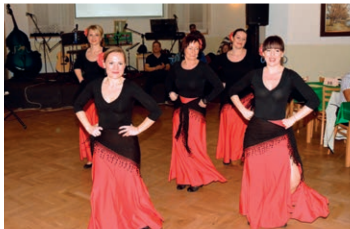
Snímky zachycující děti z T.J. Sokol Chrudim cvičící aerobic, a skvělé vystoupení žen z Bítovan tančících Flamengo...