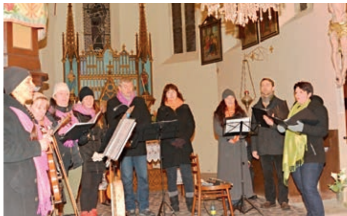
Na snímku ze soboty 7. 1. 2017 je zachycen Smíšený pěvecký sbor Bartoloměj při konání Tříkrálového koncertu v kostele sv. Bartoloměje v Bítovanech.