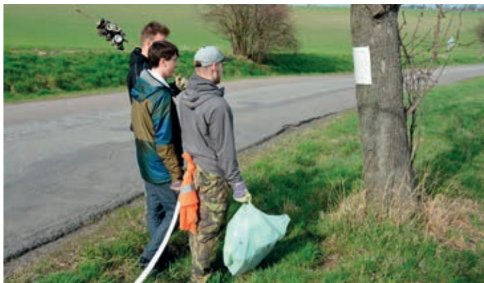
Na snímku z 25. 3. 2017 jsou Zálesáci, pozorní čtenáři výzvy nabádající k udržování pořádku kolem silnic. Anonymní výzva byla umístěna na stromě při výjezdu z obce směrem k železničnímu viaduktu.