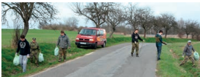
Snímek z 25. 3. 2017 zachycuje Zálesáky při sběru odpadků kolem silnice vedoucí pod železničním viaduktem ve směru ze Zaječic do Bítovan.